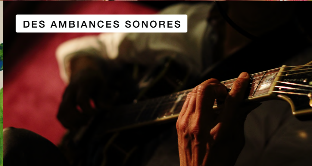
DES AMBIANCES SONORES